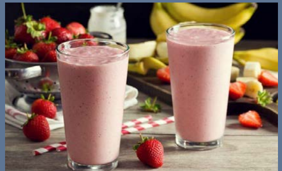
Smoothie de frutilla