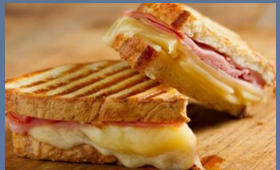
Sándwich queso y jamón